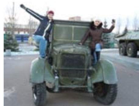
В музее военной техники

В Волжско-Камском заповеднике мы осмотрели дендрарий, побывали в музее природы с чучелами животных. На территории дендрария мы закопали бутылку с нашими пожеланиями, которую достанут через много лет. На дереве завязали ленточки и загадали желание.