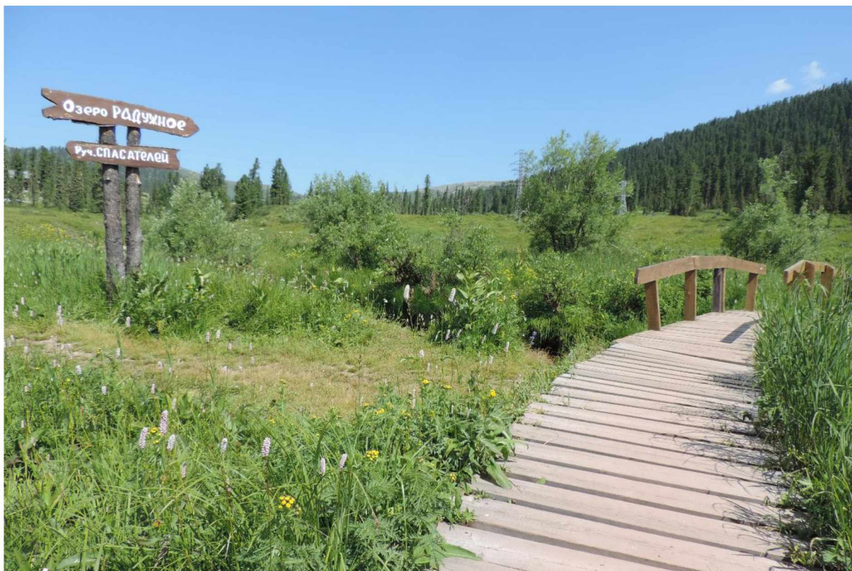
Рисунок 1 – Полотно тропы с настилом из поперечных досок перед мостиком через ручей Спасателей

На пути от входной арки до ручья Спасателей в настоящее время стенды отсутствуют и, по большому счету, не требуются. Здесь посетители наслаждаются чистым воздухом и окружающей природой: луговым разнотравьем поймы реки Нижняя Буйба, по которой идёт тропа, и видом окружающего горного ландшафта с залесёнными склонами.