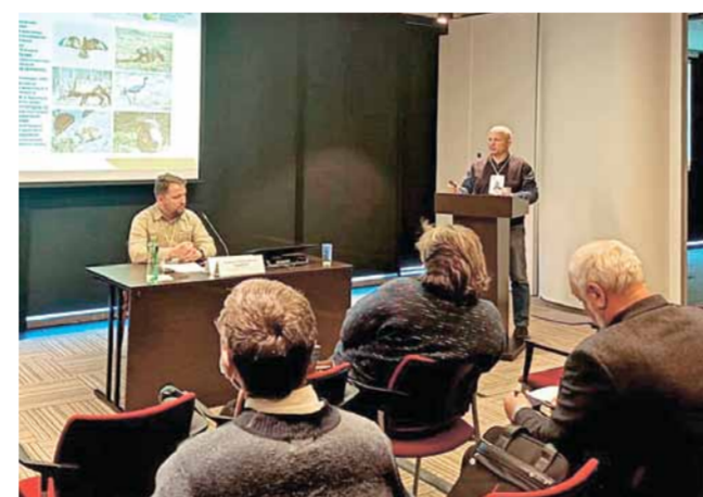
XX Международный форум «Экология большого города»

Так же этот год был полон на различные мероприятия. 24 марта парк «Ергаки» был представлен на XX Международном форуме «Экология большого города» в г. Санкт-Петербурге, где состоялась Межрегиональная конференция «Лучшие практики в развитии познавательного туризма и волонтерства на особо охраняемых природных территориях федерального и регионального значения».