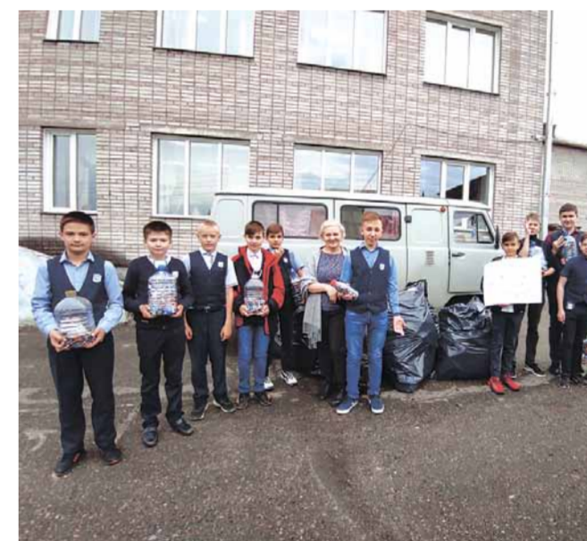
Мероприятие по сбору ПЭТ-бутылок

В начале июня проходило мероприятие по сбору ПЭТ-бутылок в рамках ежегодной экологической акции «Мы не хотим жить на свалке!». Ежегодно, в рамках этой акции, дирекция природного парка «Ергаки» организует сбор вторсырья: пластика и батареек в Ермаковском районе. Акция проходила с апреля по конец мая, в ней приняли участие об-