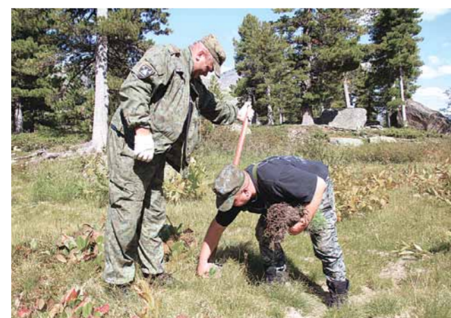
Посадка саженцев кедра на озере Художников

Конечно, главной целью Дирекции природного парка «Ергаки» является защита и сохранение уникальной природы Ергаков. Каждое лето, в рамках