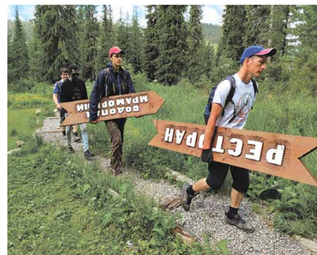
Участники волонтерского лагеря «Ветер перемен»

Зимний сезон 2020-2021 был очень снежным, что радовало любителей активного зимнего отдыха. Но, из-за большого количества снежных осадков, прошлой зимой были частые опасности схода снежных лавин, так как высота снежного покрова достигала порядка 2 метров и более. И, как следствие, сдвинулся летний туристический сезон, ведь даже в начале июля снег не таял, покрывая большие площади, чем затруднял движение в горах.