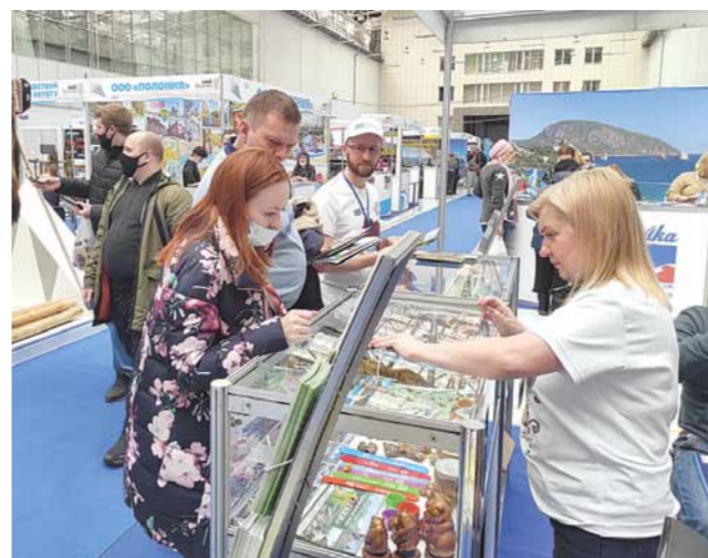
Дирекция природного парка «Ергаки» на выставке «Енисей»

С 25 по 28 марта 2021 года дирекция природного парка «Ергаки» приняла участие в XXII туристической выставке «Енисей», которая прошла в Международном выставочном центре «Сибирь» в г. Красноярске. В рамках туристической выставки для всех участников были организованы круглые столы, тренинги, семинары и встречи. На протяже-