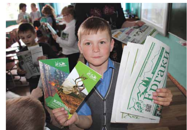
Участник эколого-просветительского мероприятия

садах и школах Ермаковского района и республики Хакасии, повышая тем самым ответственное отношение к природе у подрастающего поколения. Всего проведено 650 мероприятий, 9412 человек приняло в них участие. Акция «Календарь WWF», конкурс видеороликов «Мои Ергаки», праздник «Синичкин день», конкурс детских стихов «Ребята о зверятах», экологический урок «Снежный барс - повелитель неприступных гор», эколого-просветительское мероприятие «Используйте меньше материала» - это только малая часть всего того, что