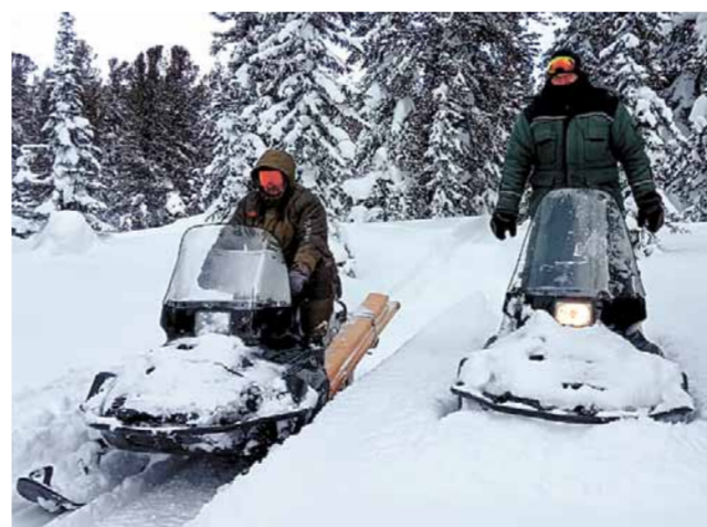
Госинспектора отдела охраны завозят пилотматериал по строительству экологических троп.

Работа отдела охраны природного парка «Ергаки» - это ежедневный, очень тяжелый труд инспекторов по защите и охране ООПТ, проведению природоохранных рейдов, маршрутных учетов, обеспечению функционирования объектов парка,