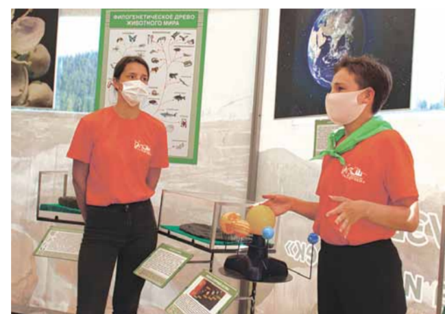
Волонтеры музея «Природа и человек»

Также в этом году летом стартовал еще один проект природного парка «Ергаки» с участием волонтеров - летний мини-музей «Природа и человек» в начале экотропы на оз. Радужное. Посетители