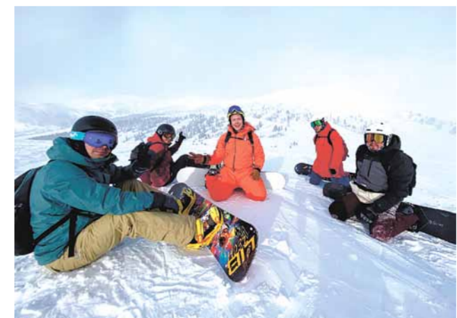
Туристы открыли горнолыжный сезон в Ергаках

В середине ноября сотрудники отдела экологического просвещения прошли программу аттестации экскурсоводов (гидов) в г. Минусинске, где прохо-