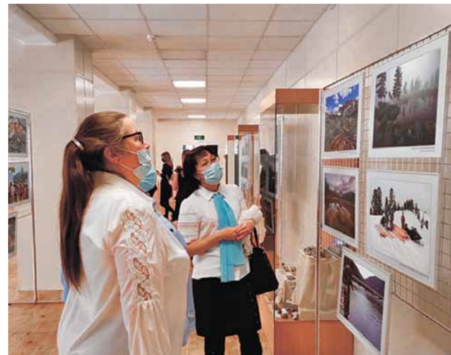
Фотовыставка «Туристическая станция «Ергаки»

Весь год проходила фотовыставка «Туристическая станция «Ергаки», приуроченная к 15-летию создания КГБУ «Дирекция природного парка «Ергаки». Стартвала она в Хакасском национальном краеведческом музее имени Л.Р. Кызласова, далее побывала в центре культуры «Спутник» с. Каратузское, в с. Верхнеуесинское. Конечным пунктом фотовыставки стал Ермаковский филиал музея-