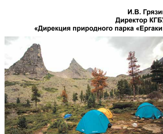
Маршруты ежегодно посещают более 120 тысяч туристов