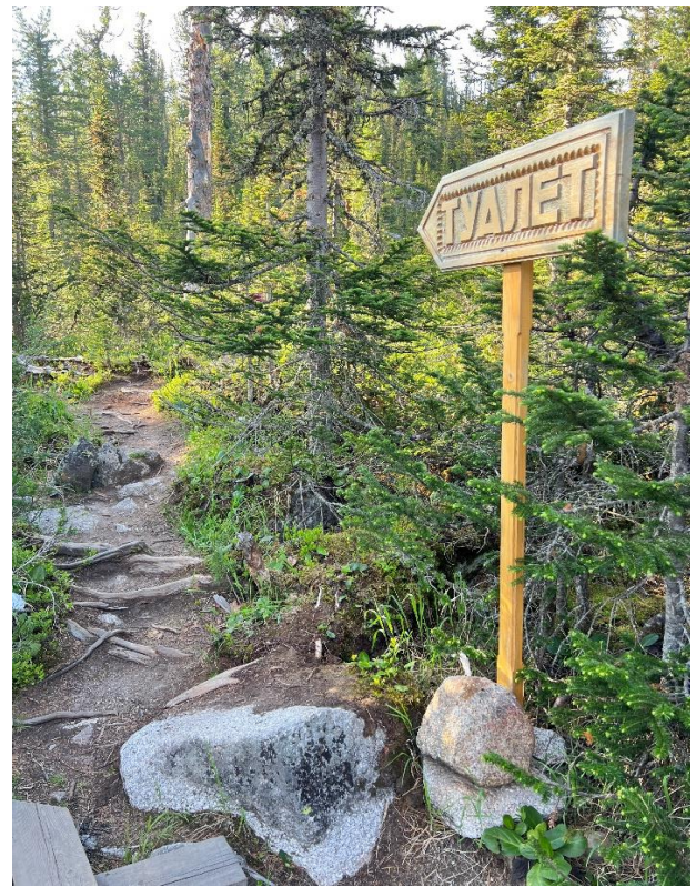
Указатель на маршруте