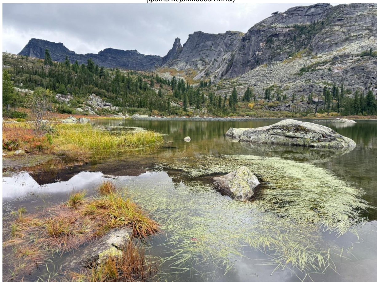
Панорамный вид с западного берега оз. Малого Буйбинского (Радужного) на Спящий Саян, Висячий камень и скалу Орешек