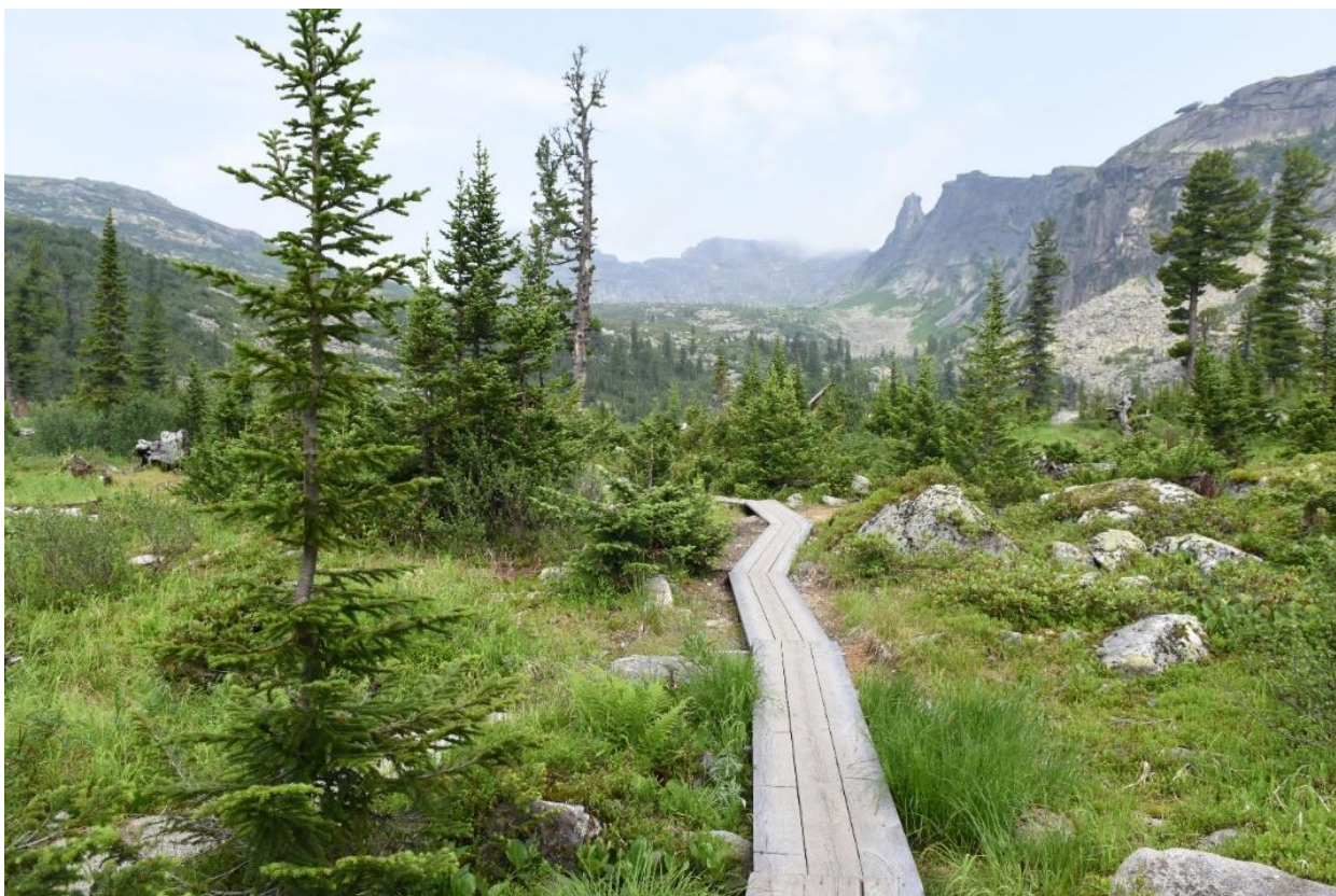
Настильная тропа на участке маршрута при подходе к оз. Малому Буйбинскому (Радужному)