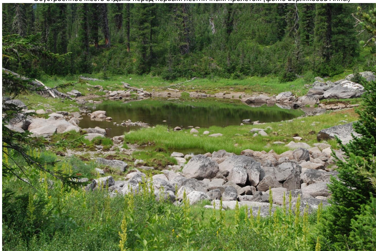
Вид оз. Уютного (июль) с пешеходной тропы