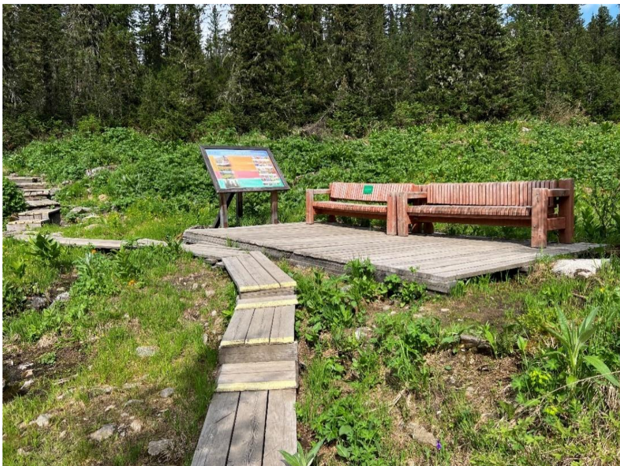
Обустроенное место отдыха перед первым лестничным пролетом