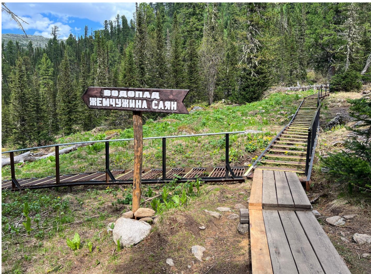
Развилка в сторону водопада Жемчужина Саян