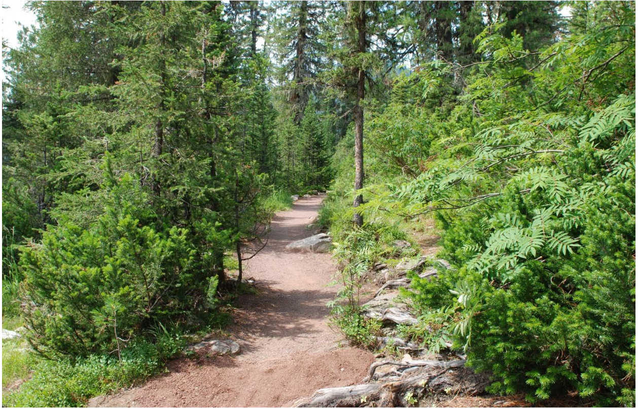
Участок тропы, отсыпанный щебнем