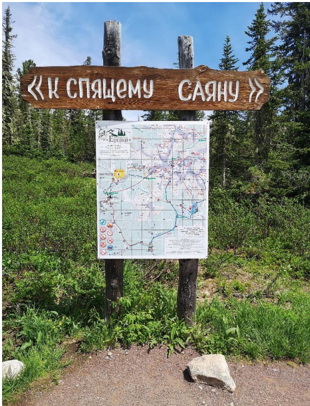
Картосхема на начале пешеходного маршрута