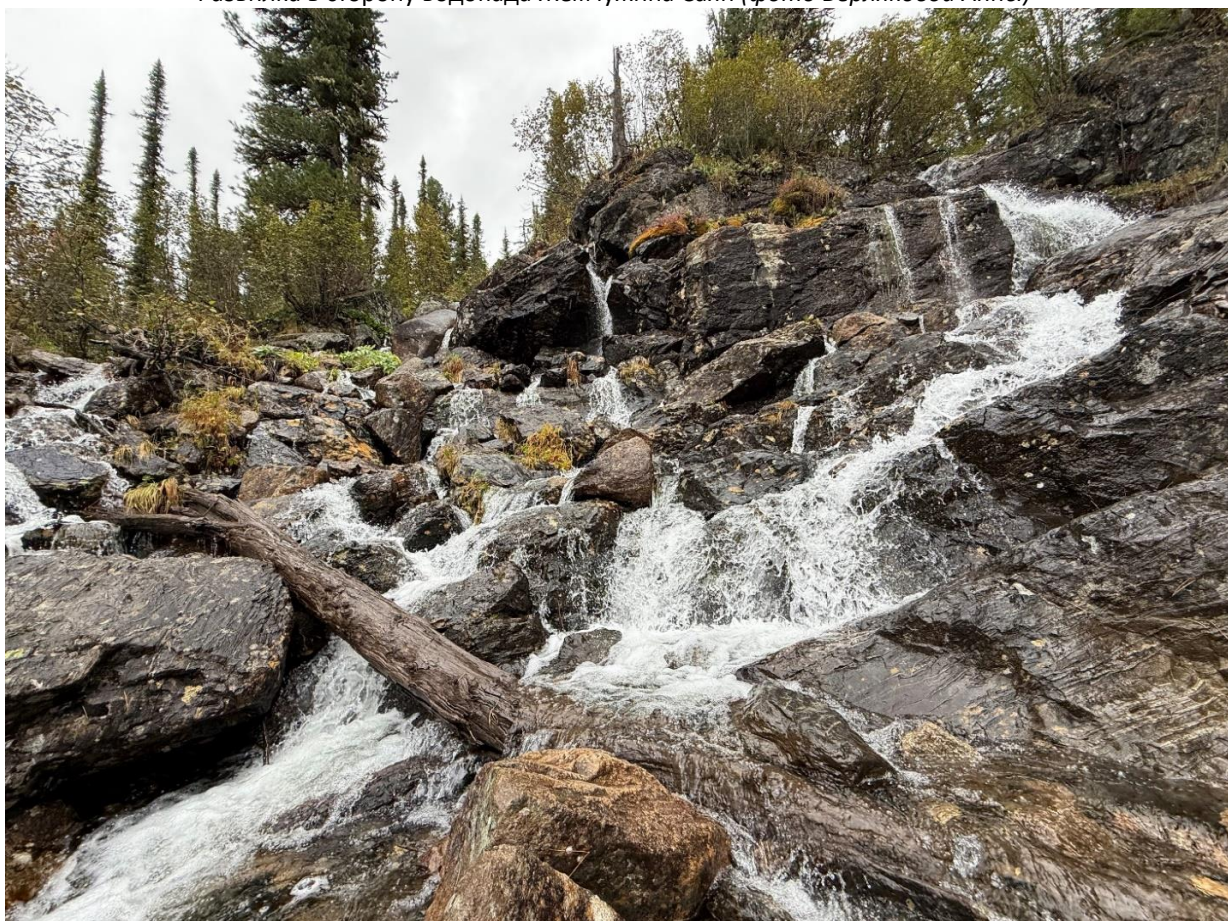
Панорама водопада Жемчужина Саян (сентябрь)