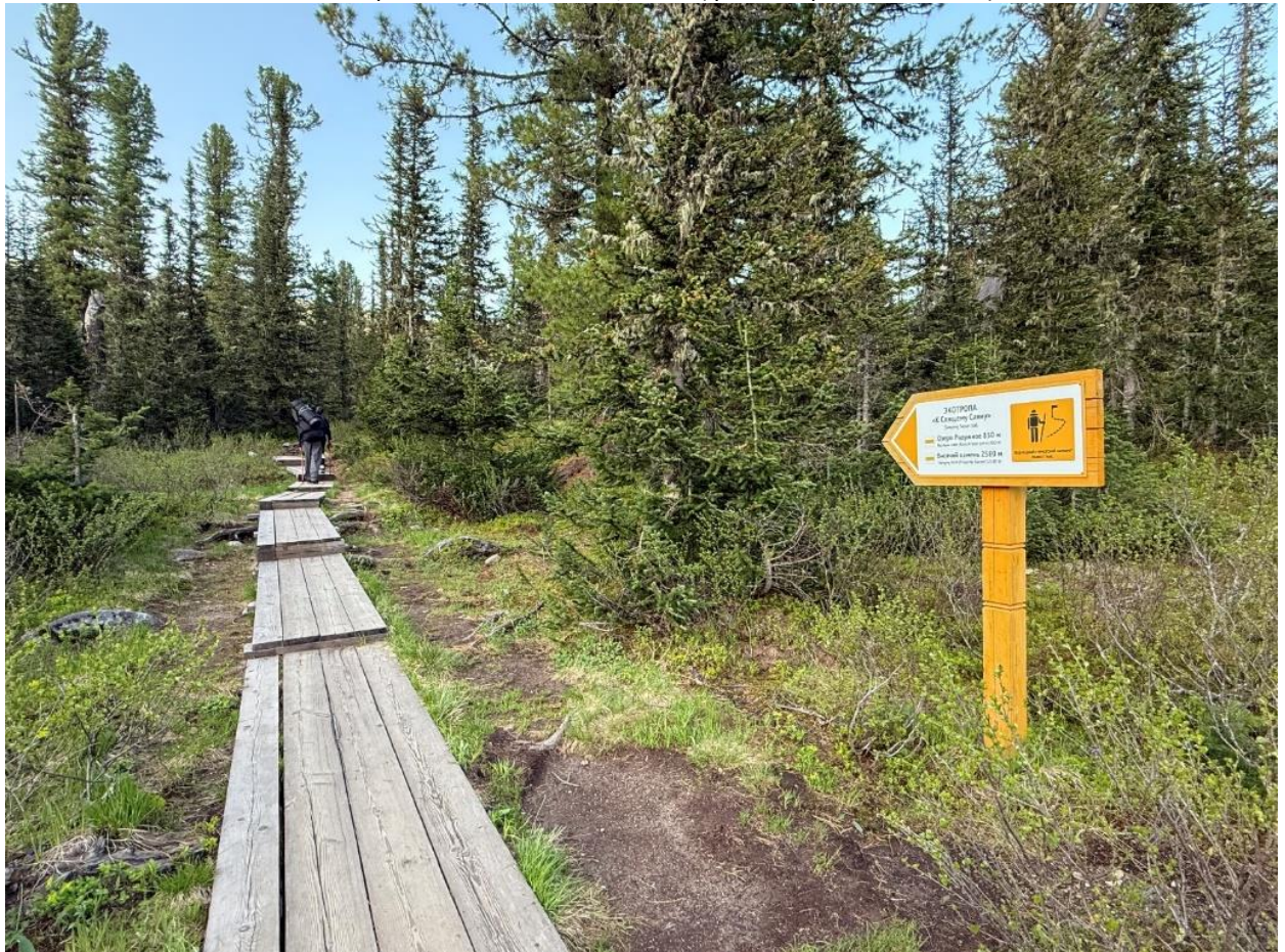
Участок тропы, обустроенный деревянными настилами