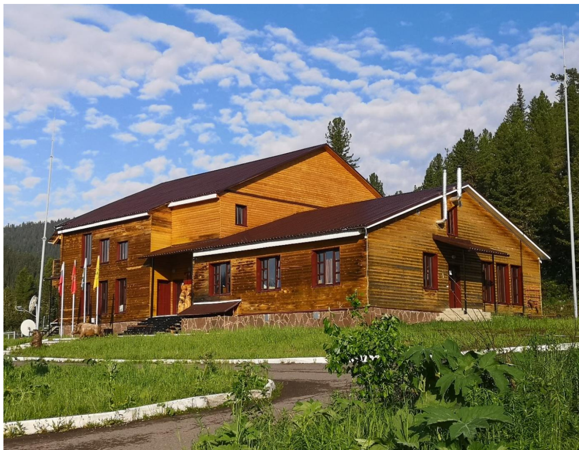
Визит-центр природного парка Ергаки