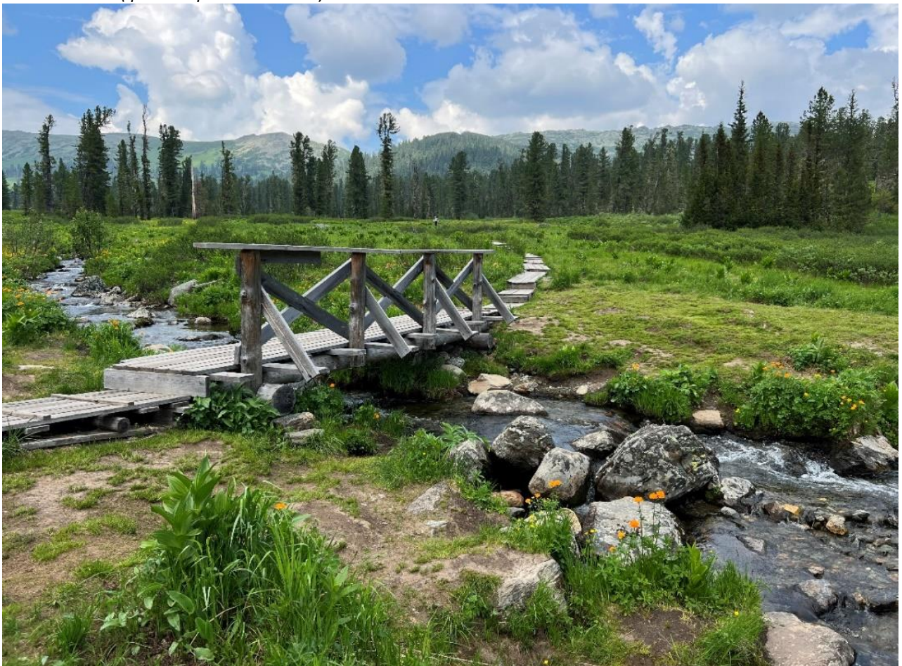
Мост через безымянный ручей (правый приток р. Малая Буйба)