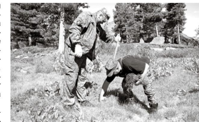
Посадка саженцев кедра