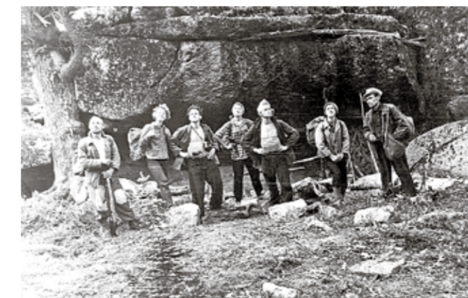
Вперед к вершинам!

В другой раз решили подойти поближе к господствующей вершине нашего района, чтобы выяснить возможность ее покорения. Поднявшись по «катушкам» («Гиперболического параболоида» (теперь - «Два брата»), и обойдя озеро, которое мы назвали