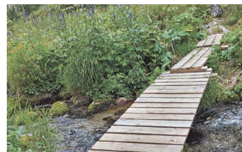
Мостик через речей Медвежий