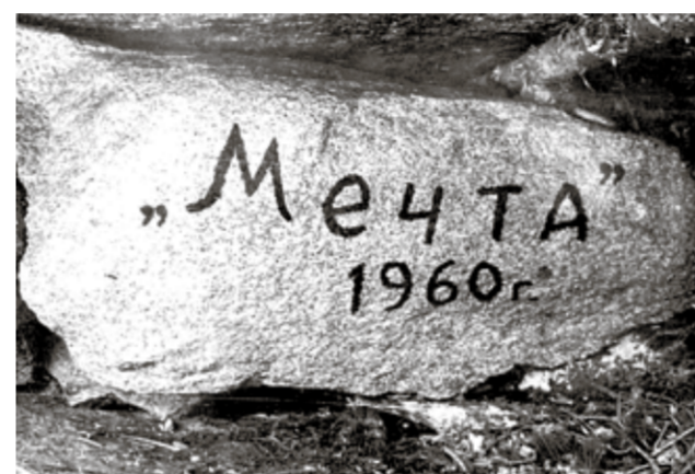
Вывеска.