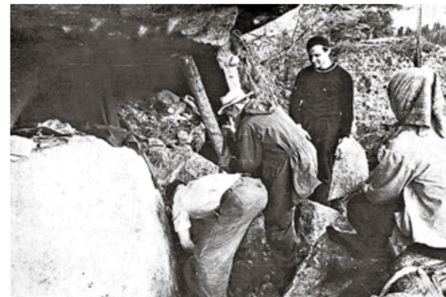
Устраиваемся.