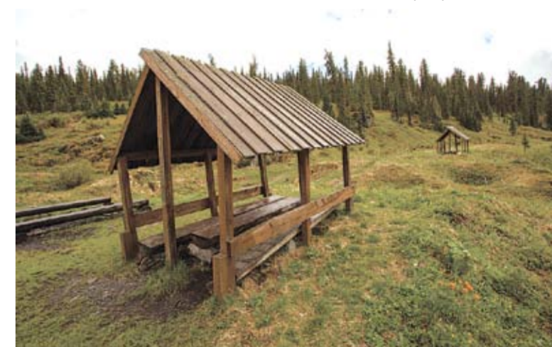
Пикниковая точка "Казачий ключ"

самые значимые природные достопримечательности парка: оз. Радужное, скальный массив Спящий Саян, скалу Висячий камень, оз. Каровое, вдп. Мраморный, пики Птица и Звездный, оз. Светлое, руч. Тушканчик.