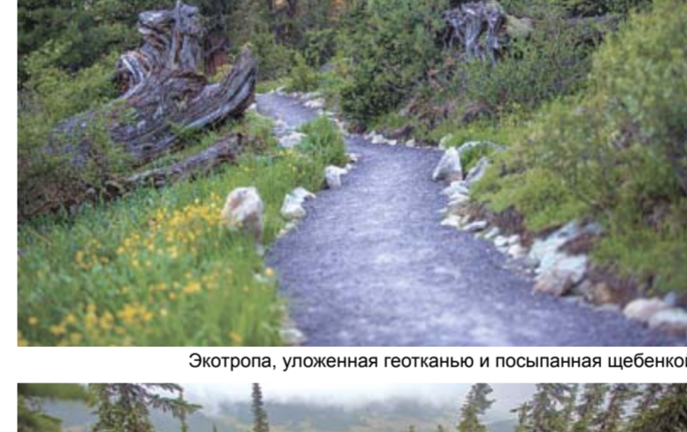
Экотропа с деревянными дорожками