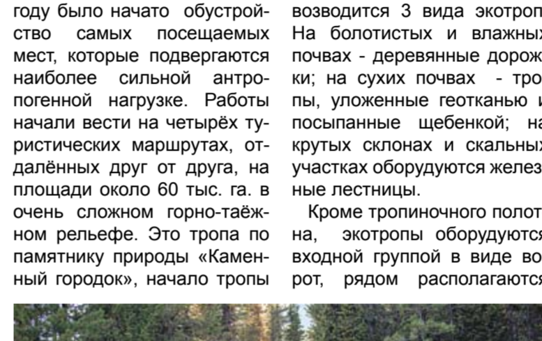
Подъём с железной лестницей