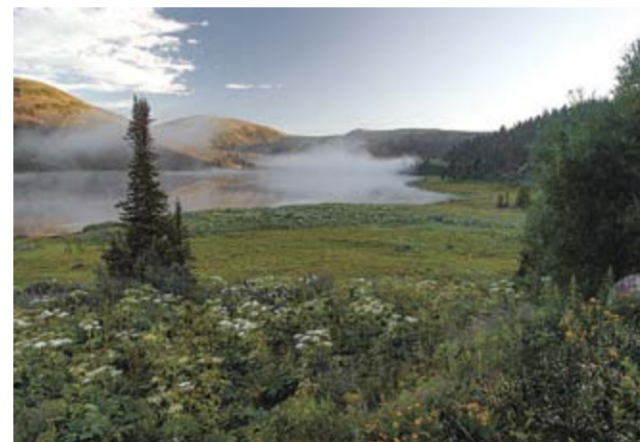
Нерозя Александр «Туман над Ойским»