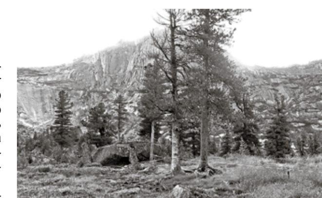
Огороженная территория, где запрещена установка палаток