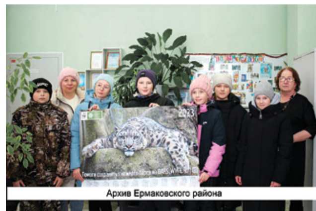
Архив Ермаковского района

Пресс-служба КГБУ «Дирекция природного парка «Ергаки»