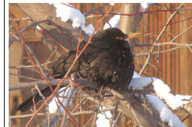
Чёрный дрозд.

Благодаря наблюдательности юных экологов из Усинского школьного лесничества, под руководством Федоровой О.В., с которыми Дирекция Парка плодотворно сотрудничает уже несколько лет, список видового разнообразия парка пополнился редким для нашего региона видом.