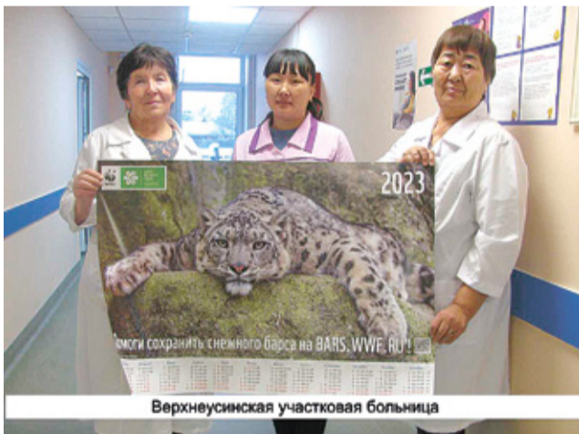
Верхнеусинская участковая больница