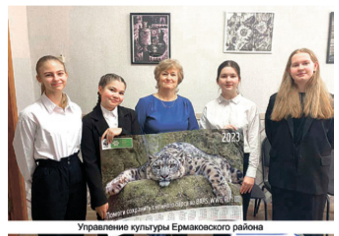
Управление культуры Ермаковского района