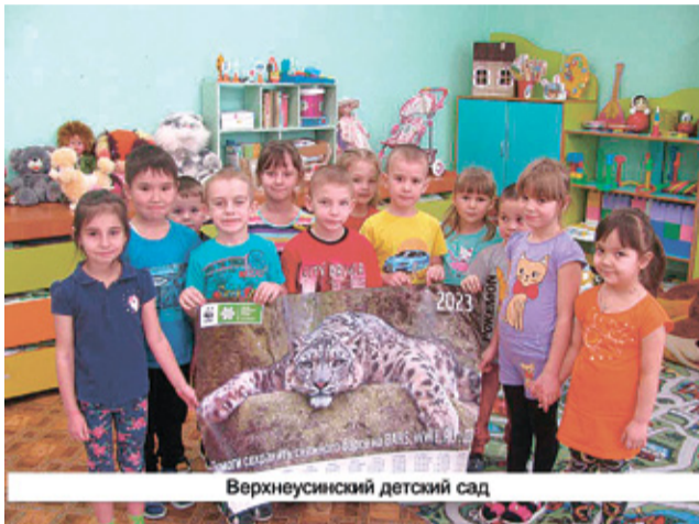
Верхнеусинский детский сад