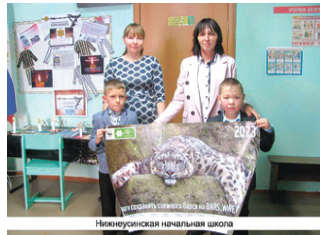
Нижнеусинская начальная школа