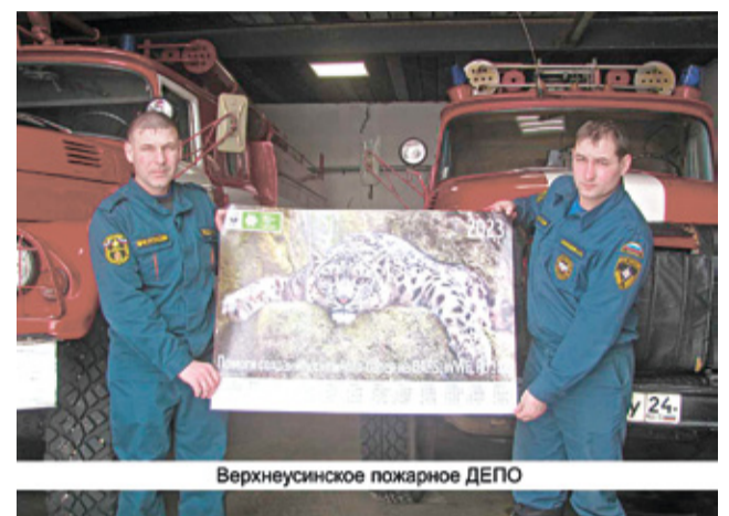
Верхнеусинское пожарное ДЕПО