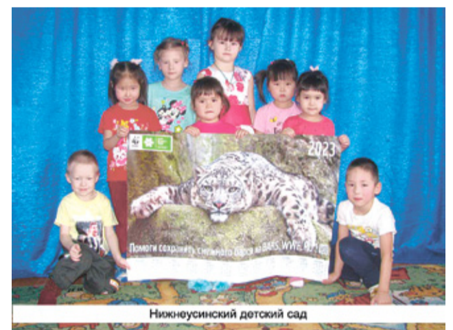
Нижнеусинский детский сад