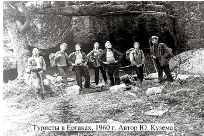
Туристы в Ергаках, 1960 г.

На конкурс принимаются черно-белые и цветные фотографии, снятые на территории современного природного парка «Ергаки» до 2004 года включительно. Каждый участник имеет право предоставить на Фотоконкурс не более 5 работ. Фотографии