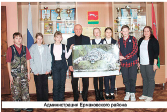
Администрация Ермаковского района