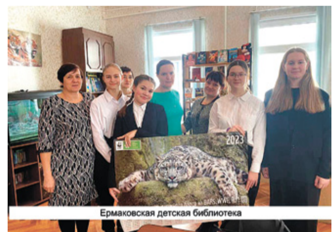
Ермаковская детская библиотека