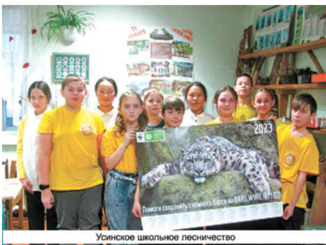
Усинское школьное лесничество

На протяжении 10 лет Дирекция природного парка «Ергаки» сотрудничает с WWF России и доброй традицией стала экологическая акция «Календарь WWF». Акция проводится всеми Клубами друзей WWF для привлечения внимания общественности к сохранению редких видов животных и пропаганды деятельности Клубов.